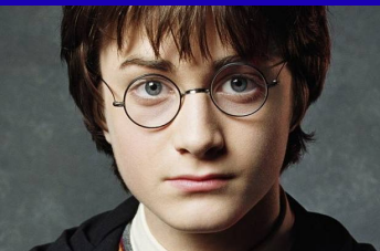
Harry Potter attend les 4 èmes en Angleterre!

Les 4 ème Euro partiront donc pour un voyage éducatif entre le 10 et le 15 Avril pour visiter Londres et profiteront de l'occasion pour étudier le fameux roman. Comme les années précédentes, ils seront répartis dans des familles accueillant entre 2 et 4 élèves. Au programme, des musées, des promenades, des nouvelles coutumes