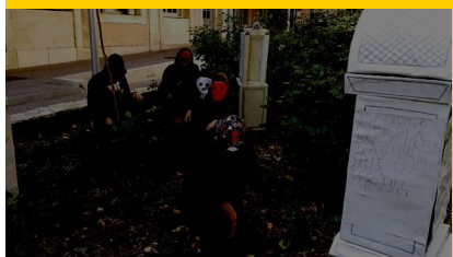
Halloween au collège Clémenceau!